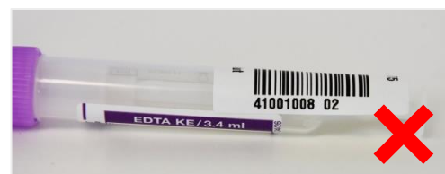
Fig. 3 Etichetta sporgente

Le etichette poste in modo errato comportano un tempo di elaborazione più lungo che si potrebbe evitare a vantaggio di una refertazione più rapida (Fig. 3).