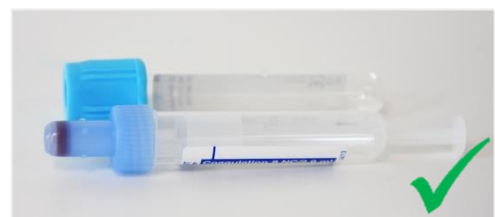
Fig. 2 Finestra di ispezione libera

Sulla provetta deve obbligatoriamente rimanere una finestra di ispezione verticale libera, di una larghezza minima di 8 mm (non coperta da etichetta o scritte) (Fig. 2) che serve per il riconoscimento automatico di emolisi, lipemia o ittero. Inoltre il volume del campione viene misurato per l'aliquotazione automatica del campione.