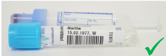
Fig. 1 Marcatura corretta delle provette

Sulla provetta deve obbligatoriamente rimanere una finestra di ispezione verticale libera, di una larghezza minima di 8 mm (non coperta da etichetta o scritte) (Fig. 2) che serve per il riconoscimento automatico di emolisi, lipemia o ittero. Inoltre il volume del campione viene misurato per l'aliquotazione automatica del campione.