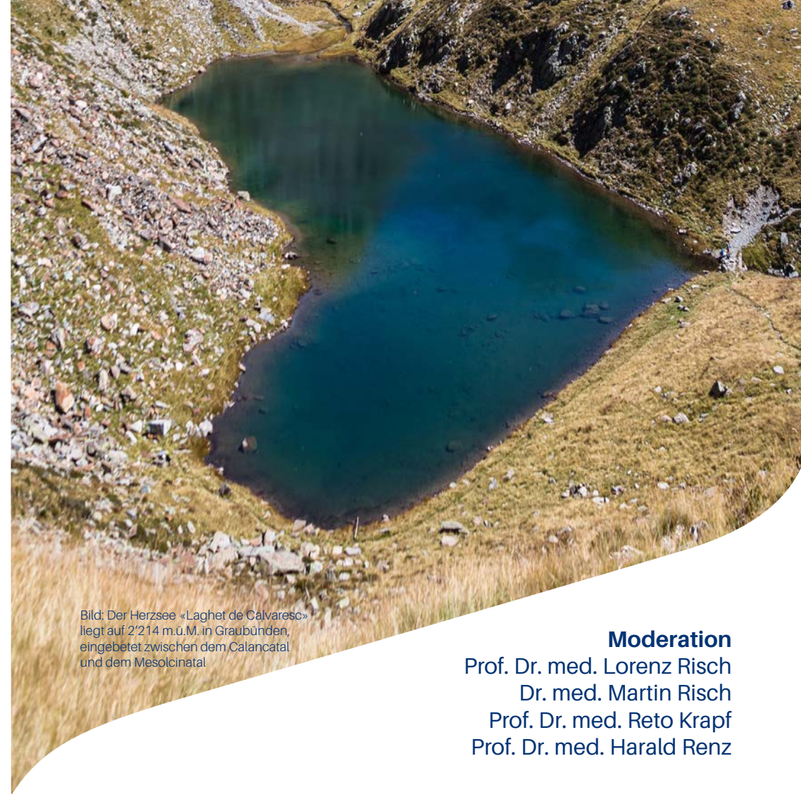
Bild: Der Herzsee «Laghet de Calvaresc» liegt auf 2'214 m.ü.M. in Graubünden, eingebettet zwischen dem Calancatal und dem Mesolcinatal